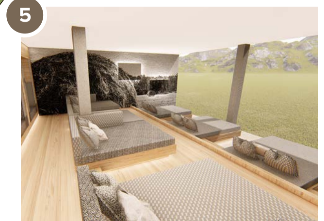
2000m 2 AQUALAND