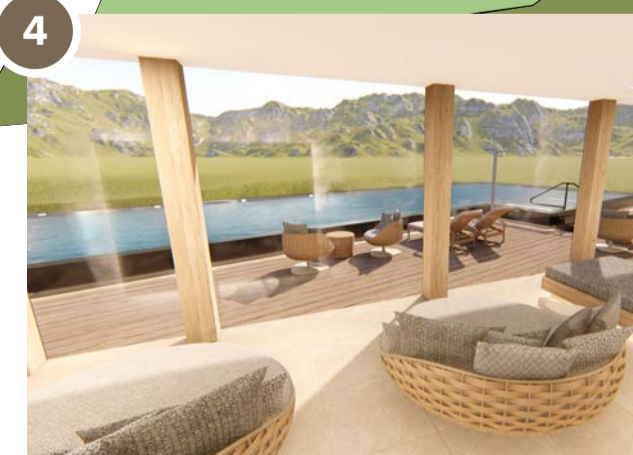
ERWACHSENEN SPA MIT INFINITY POOL