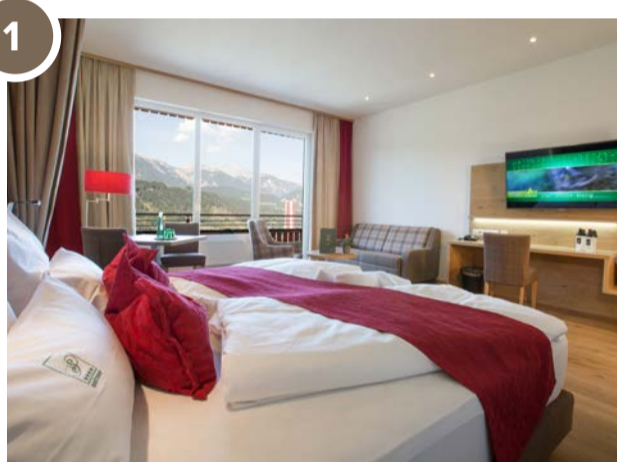
DIE NEUEN DOPPELZIMMER DELUXE

Unsere Hotelbar wird um eine großzügige Panoramabar erweitert. Auf der Westseite erhält der Schütterhof neue Doppelzimmer Deluxe (30 m 2 ) mit Blick auf den Dachstein. Diese drei neuen Bereiche werden im Sommer 2019 in Etappen eröffnet: